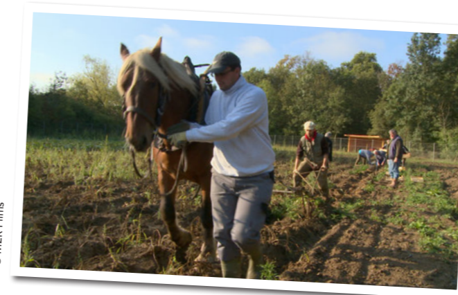
• Récolte de pommes de terre par la Régie municipale