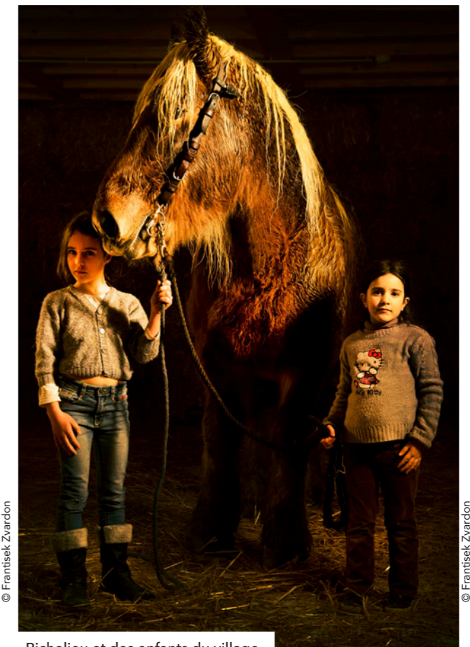
Richelieu et des enfants du village