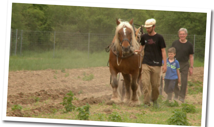
• La transition mobilise les bénévoles