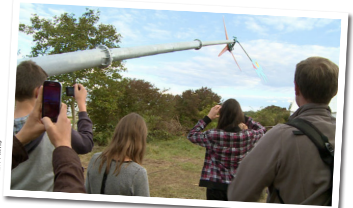
• L'essai de l'éolienne Piggott construite en chantier participatif