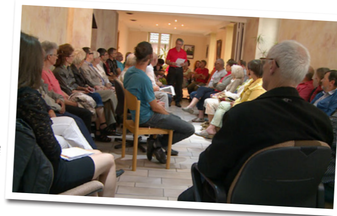
• Démocratie participative

Instaurée dès 2009, la démocratie participative constitue la pierre angulaire du programme de transition d'Ungersheim. Quelque quatre-vingts habitants se réunissent régulièrement pour envisager ensemble « le village de demain ». On y parle de « pic pétrolier », de « dépendance énergétique », de « réchauffement climatique », d'« emplois », et de « résilience ».