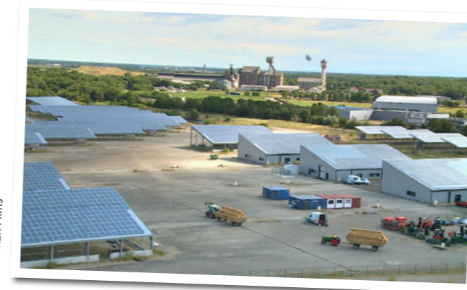
• La centrale solaire d'Ungersheim