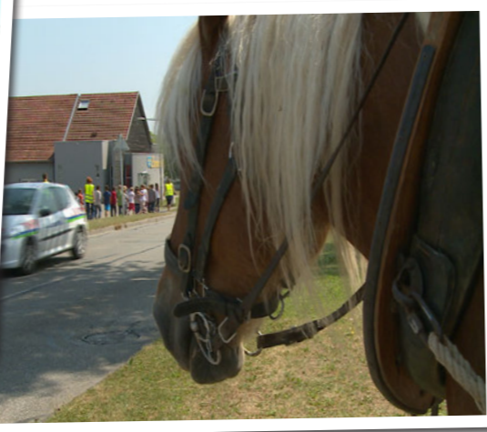
• La mascotte d'Ungersheim