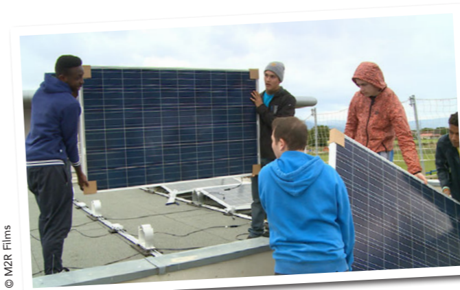
• Installation de panneaux photovoltaïques sur un bâtiment municipal

La commune a bien sûr banni l'utilisation de pesticides . Depuis 2006, les techniciens municipaux n'utilisent plus aucun pesticide ou engrais chimique pour l'entretien des espaces verts. Ungersheim a reçu le label « trois libellules » octroyé par la région Alsace et l'agence de l'eau Rhin-Meuse, ainsi que le prix des Trophées de l'Innovation en 2013. Les employés du service technique sont équipés de vêtements de travail en coton bio issu du commerce équitable et sont étroitement associés au processus de transition.