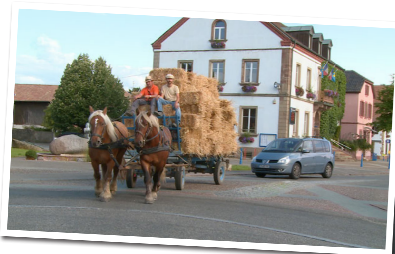
• Richelieu et Kosak, les chevaux municipaux