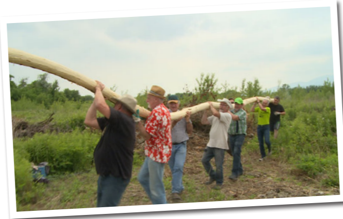
• Construction de la Maison des Natures et Cultures

Favorisé par la commune, cet Éco-hameau comprend neuf maisons et appartements. Réunis en société civile immobilière, les copropriétaires ont signé une charte, jointe à l'acte de vente du terrain. Elle reprend les dix principes dits de « Bedzed » ( www.fr.wikipedia.org/wiki/BedZED ), du nom d'un quartier du Sud de Londres totalement autonome du point de vue énergétique : zéro-carbone, zéro-déchet, construction passive, etc.