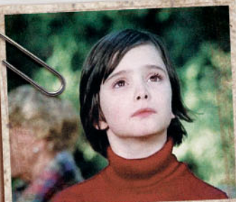
Ana Torrent Interprète d'Ana

On se souvient d'elle pour... avoir été cette petite fille aux grands yeux noirs traînant sa mélancolie dans le sous-pull rouge de Cría Cuervos . Mais aussi pour son « come-back » en 1996 dans le thriller culte Tesis .