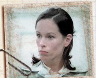
Geraldine Chaplin Interprète de Maria et Ana

On se souvient d'elle pour... les neuf films qu'elle a tourné en Espagne sous la direction de son compagnon Carlos Saura. Et notamment pour le double rôle émouvant de Cria Cuervos . Par ailleurs, nul n'a oublié que la fille du grand Charlot a été la discrète épouse du docteur Jivago.