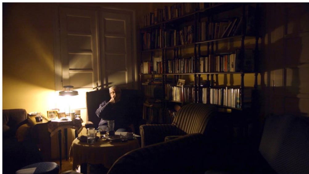
Le salon où se trouve la porte de séparation

Partie de l'appartement confisquée en 1949