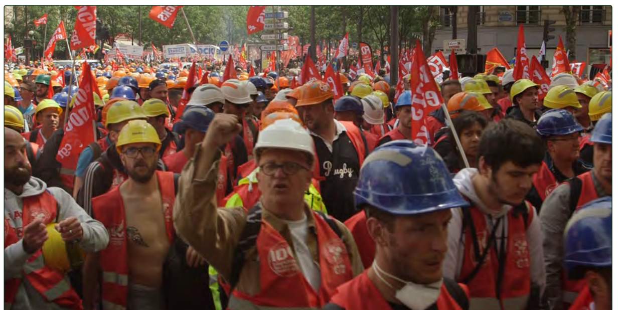
Manifestation contre la loi travail, 15 Juin 2016

Je voulais que cette histoire sonne juste, qu'elle soit directement liée à la mémoire des Havrais et que ce ne soit pas un récit historique ou de spécialiste. Il fallait que ça résonne dans le vécu des gens.