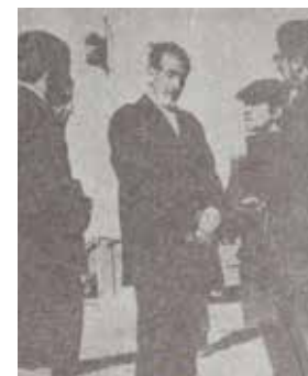
Prisioneros políticos en Isla Dawson

Lee en el dossier de prensa las informaciones referidas a las siguientes fechas y completa las frases con un resumen en español: